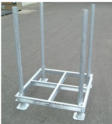
b4) Palette-Achs (AP)

ACHTUNG: zulässiges Höchstgewicht FIRMA AL-KO: 2000 kg