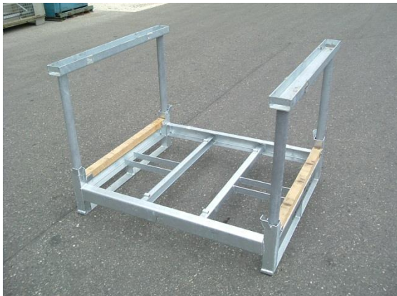
b3) Palette-Rahmen mit Profilholz (RP)

AL-KO Material-Nr. Kötz 1.213.544 (AL-KO Material-Nr. Vintl 209.347)