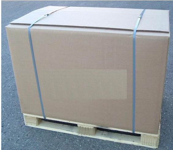
b2) Flachpalette-Einweg mit Karton (FP-EW-K)